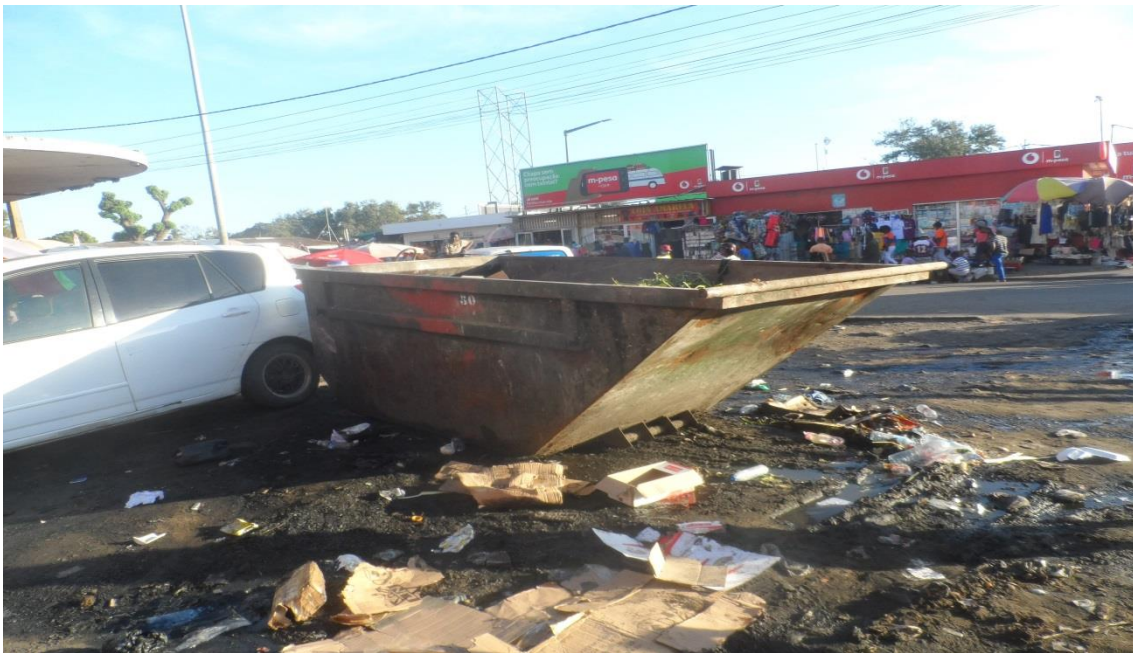
Fig. 15 - O contentor de deposito de resíduos sólidos colocado em frente do mercado Xipamanine usado pelos utentes não só para deposito mas sim como sanitário público devido a falta de sanitários em condições ambientalmente aceitáveis