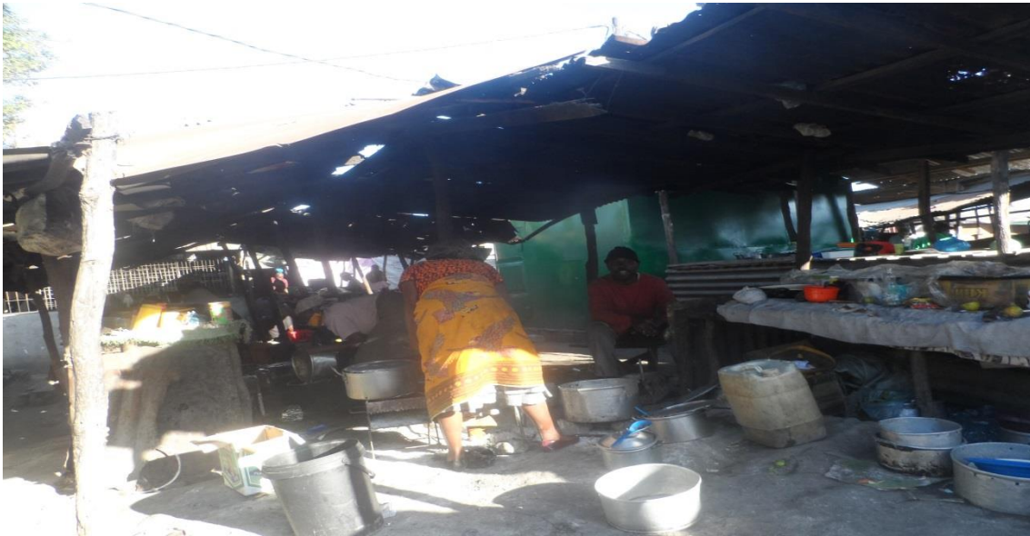
Fig. 16 - Confeccionamento de comida em condições ambientalmente inadequada no mercado informal do Xipamanine