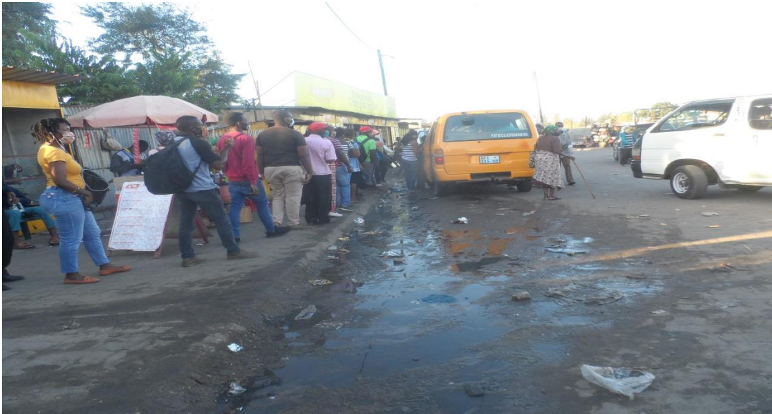
Fig. 14- Águas residuais do mercado Xipamanine escorrendo pelas ruas devido a falta de valas de drenagem