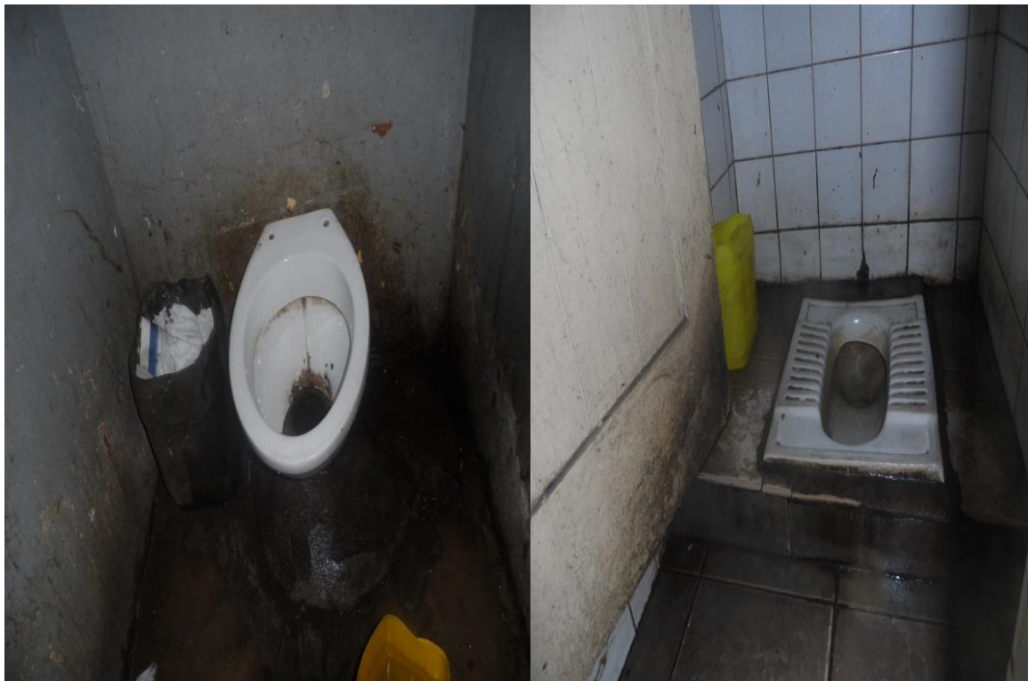
Fig. 5e 6 as casas de banho do Mercado formal de Xipamanine