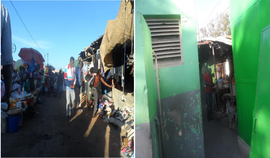
Fig. 10 e 11 Vias de acesso não pavimentadas , condicionamento da mobilidade e falta de drenagens para escoar água da chuva no Mercado.