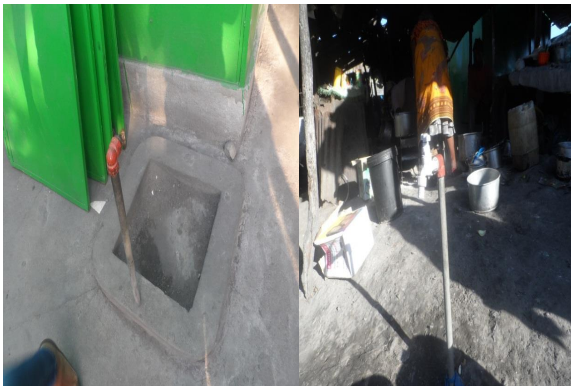
Fig. 3-4 as torneiras sem nenhum sinal de jorrar água devido a não funcionamento do sistema de abastecimento de água do Mercado