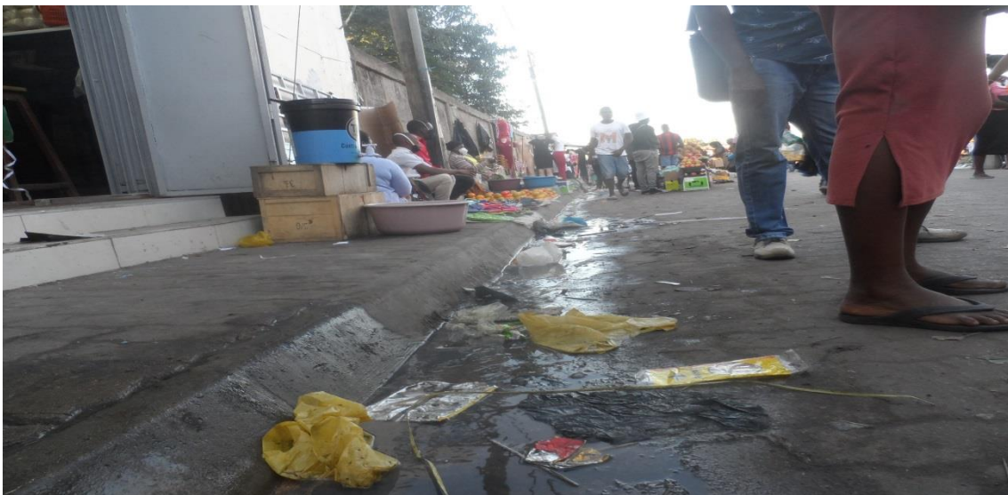
Fig.17- comércio informal de produto de rápido consumo (laranjas, bananas, maçã etc) nos passeios e ruas do mercado Xipamanine formal