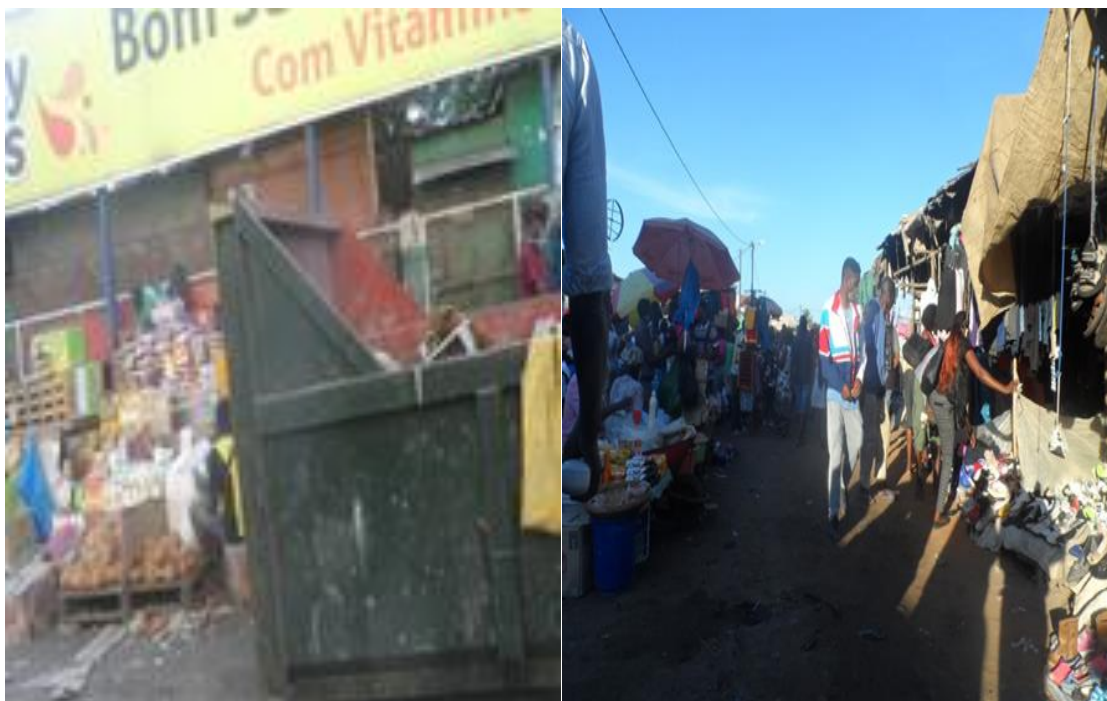
Fig. 12 e 13 Actividades comerciais no mercado informal Xipamanine em locais inapropriados

As imagens abaixo retratam algumas das actividades desenvolvidas no mercado de Xipamanine.