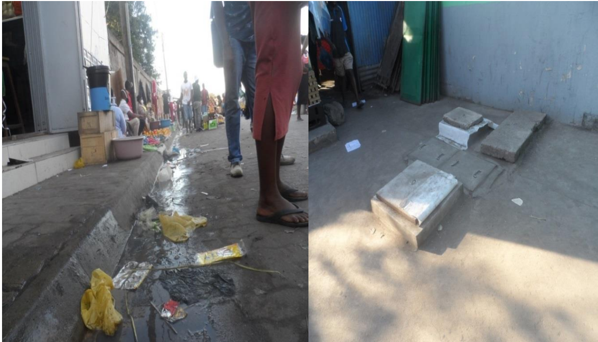
Fig. 8 e 9 Águas residuais escorrendo pelas vias de acesso devido a falta das valas de drenagem e falta dos esgotos sanitários, usadas fossas sépticas para os sanitários não satisfazendo a demanda do Mercado devido ao número de usuários.