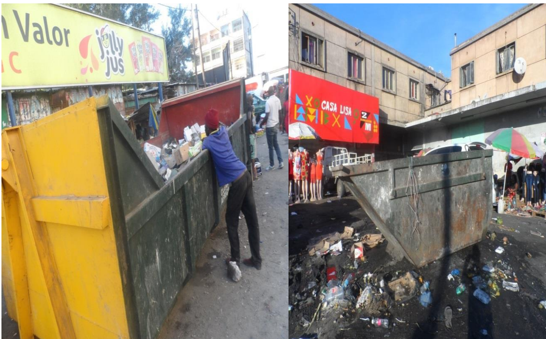
Fig. 1 e 2 Locais de depósito de resíduos sólidos do mercado Xipamanine