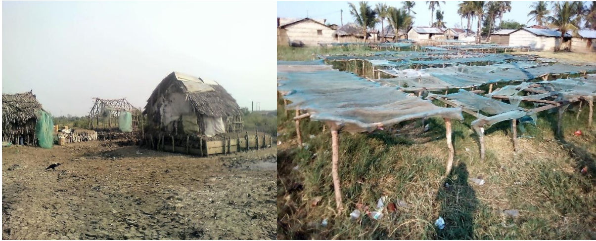
Figura 6: Algumas residências dos pescadores do Estuário dos Bons Sinais.