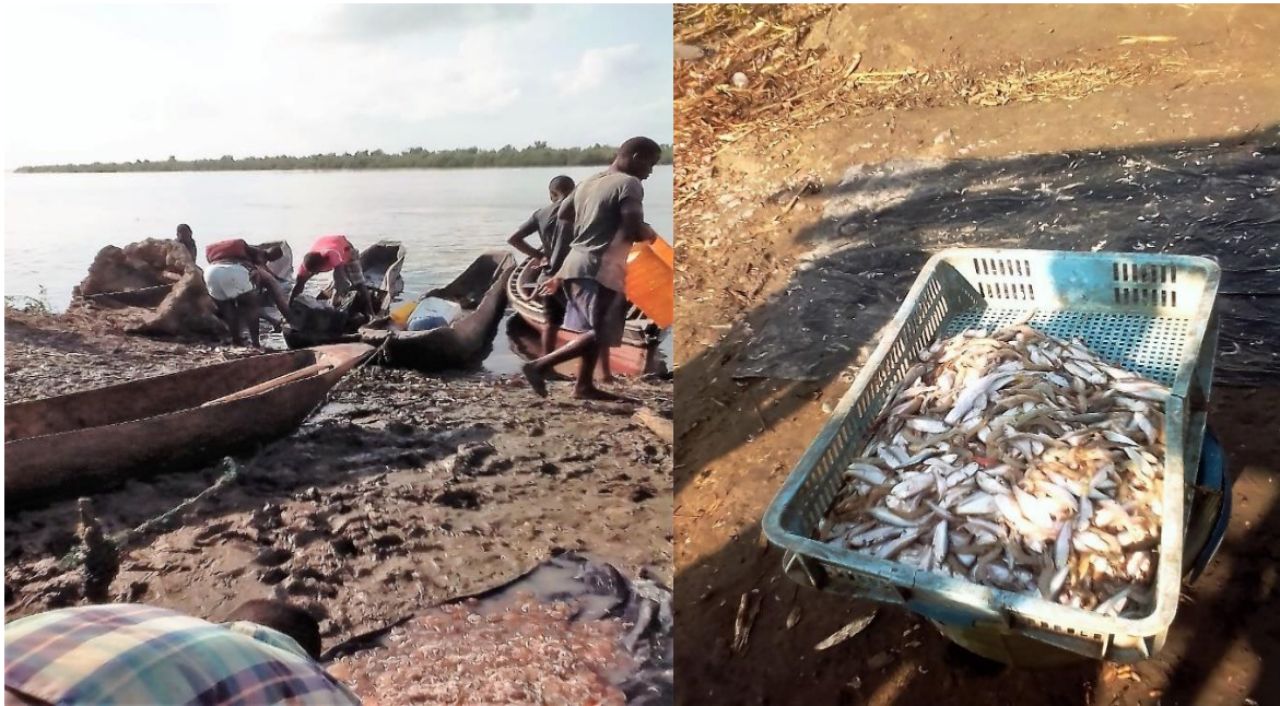
Figura 4: Desembarque do pescado no Estuário dos Bons Sinais