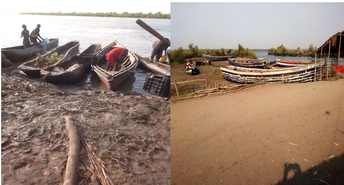
Figura 5: Principais tipos de embarcações usadas para a pesca no Estuário dos Bons Sinais