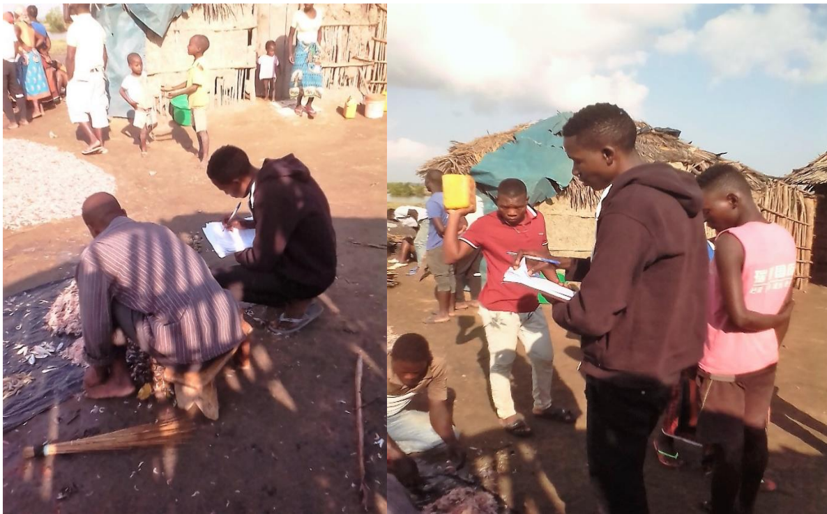
Figura 3: Pescadores respondendo as questões do inquérito.