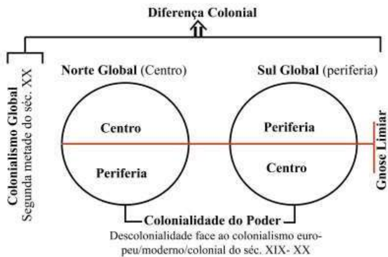
Figura 1: Polos da Diferença Sub-ontológica e Colonial