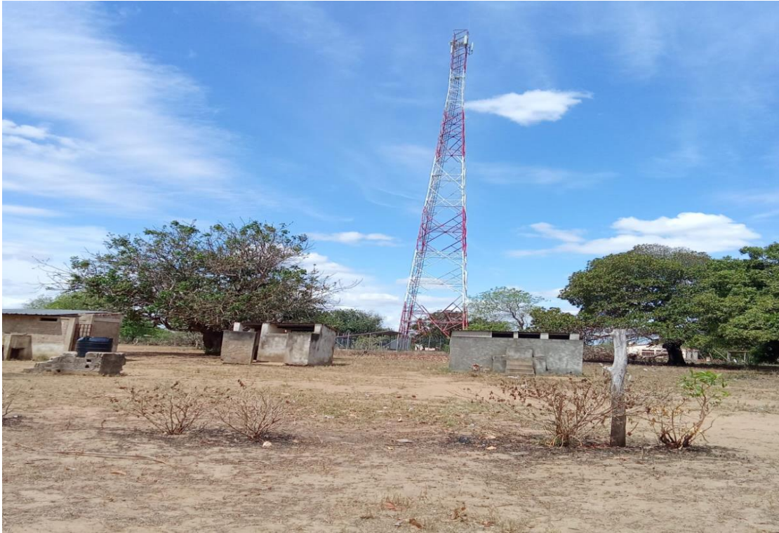
0Figura 3- Instalações sanitárias edificadas no âmbito do projecto da World Vision.