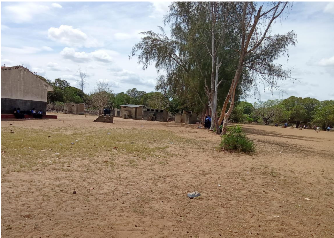
Figura 4- instalações sanitárias.