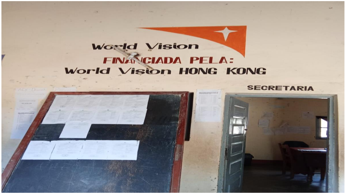
Figura 7- Logotipo da World Vision estampada no bloco administrativo da escola.