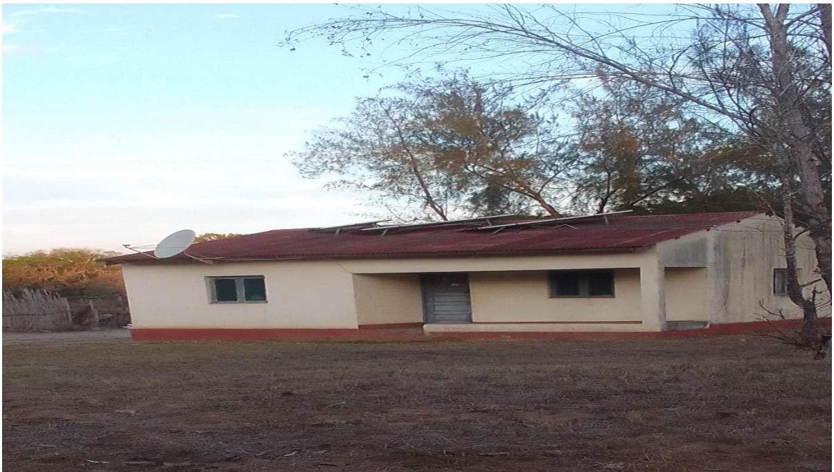
Figura 6: casa tipo um para Director da escola