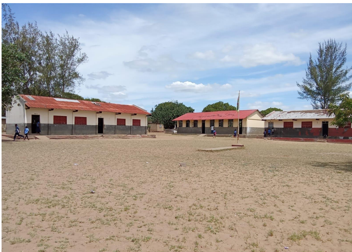
Figura 2- 6 Salas de aulas construídas pela World Vision na EPC de Chipadja. Fonte Autor, 2025