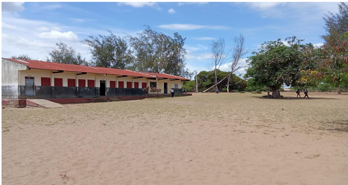
Figura 1- Duas salas de aula e bloco administrativo anexo.