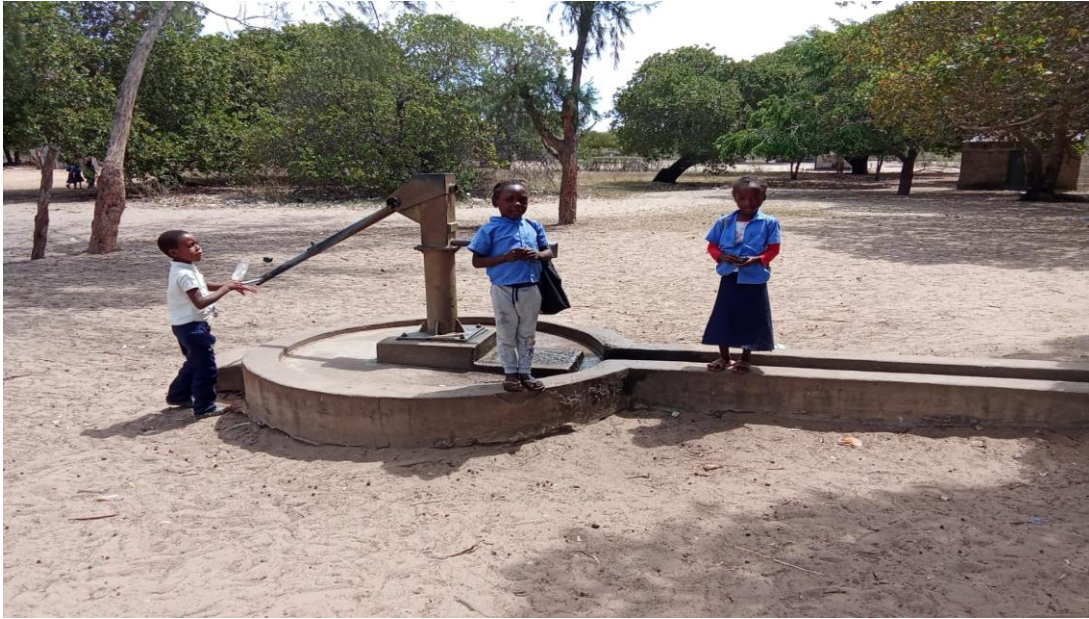
Figura 5- Fontanária montada pela World Vision para beneficiar a escola.