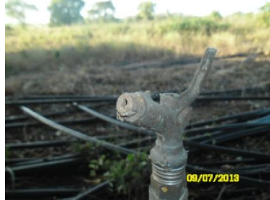
Aspersor do sistema em estudo