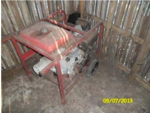
Moto-bomba do sistema em estudo