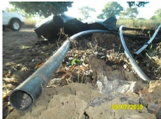
Tubos do sistema de irrigação em estudo