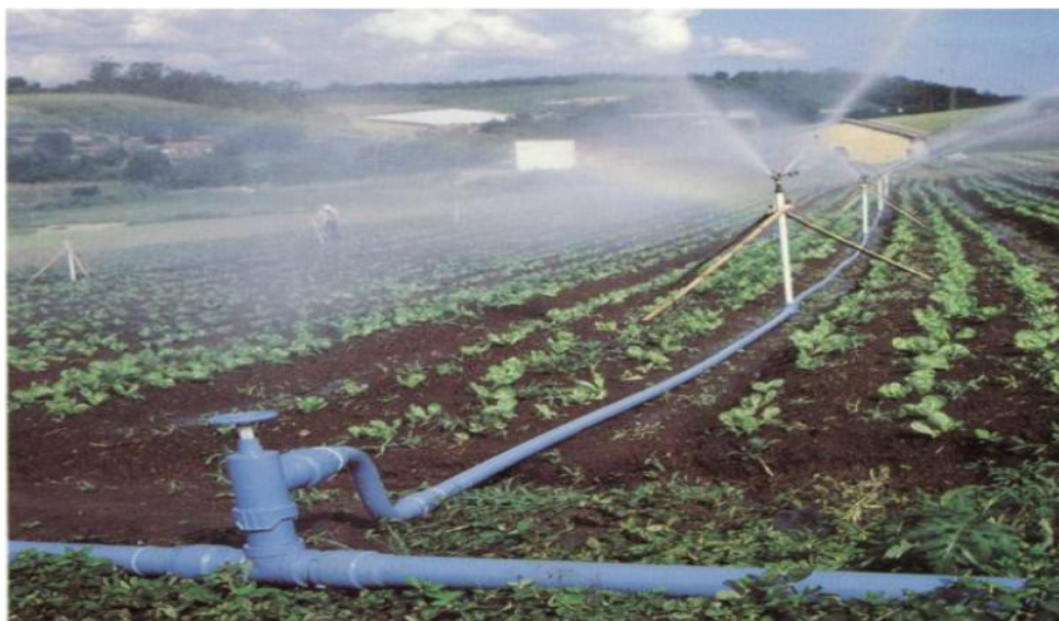
Figura 1: Vista de um Sistema de Rega por Aspersão Convencional.

MARCHETTI (2006) afirma que, os sistemas por aspersão convencional fixos são os que as linhas laterais são fixas, ficando permanentemente nas suas posições, isto é, não sendo necessário mover as linhas laterais para poder irrigar toda área. Enquanto que, os móveis são os que as linhas laterais movem-se para poder irrigar toda área, estes são geralmente usados por pequenos e médios agricultores que não possuem fundos suficientes para aquisição de um sistema que possa cobrir área inteira sem se mover.