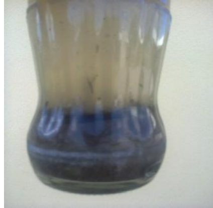
Figura 3: Determinação da Textura do Solo Usando Garrafa Transparente e Água