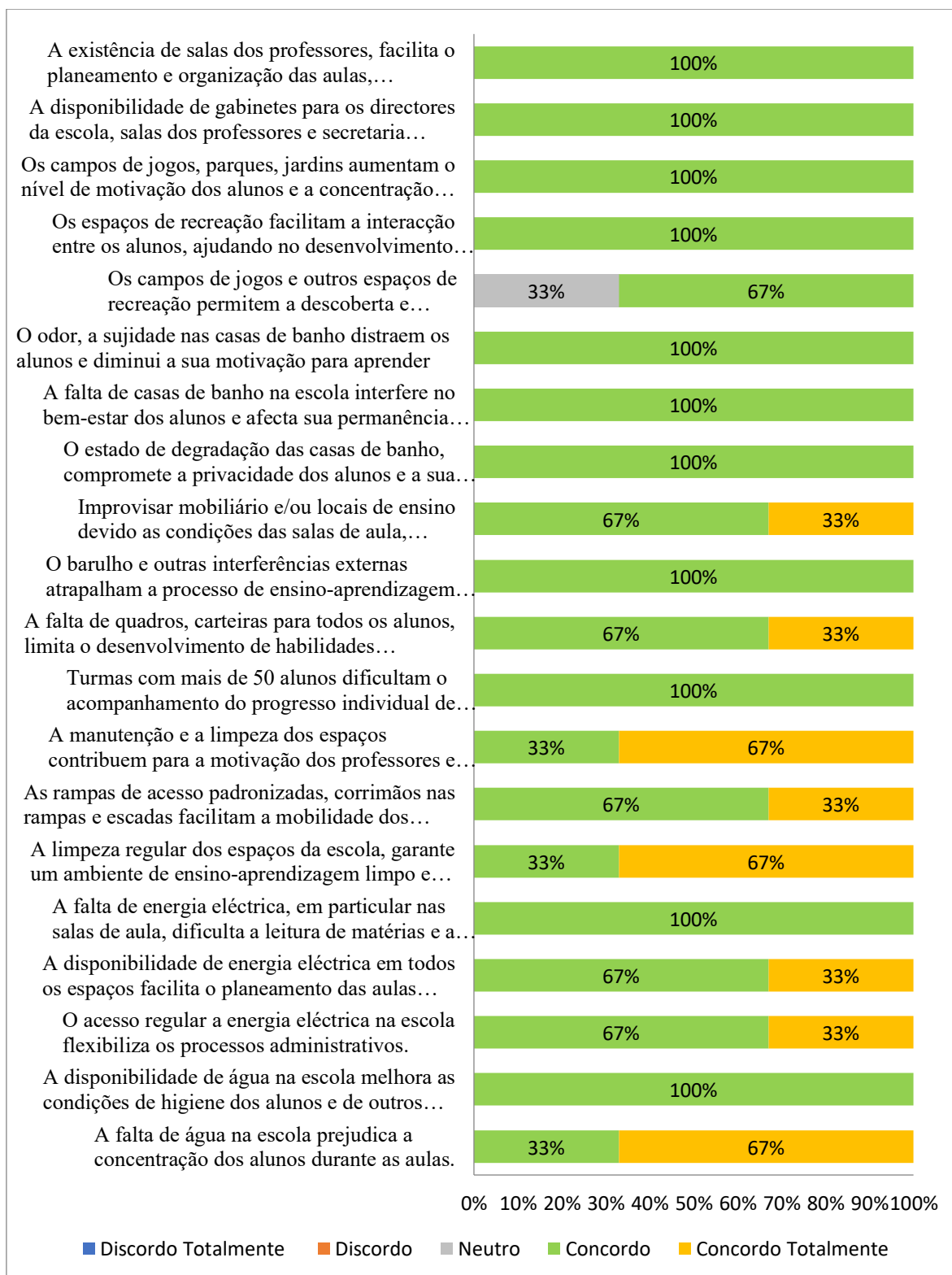
Gráfico 1 Percepções dos Directores sobre as implicações das condições físicas da infra-estrutura das escolas no desempenho académico dos alunos.