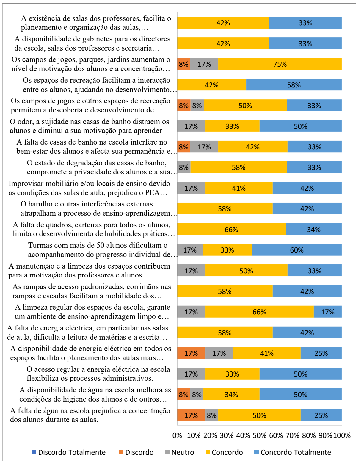
Gráfico 2 Percepções dos Professores sobre as implicações das condições físicas da infra-estrutura das escolas no desempenho académico dos alunos.

Fonte: Elaborado pela investigadora (dados da pesquisa)