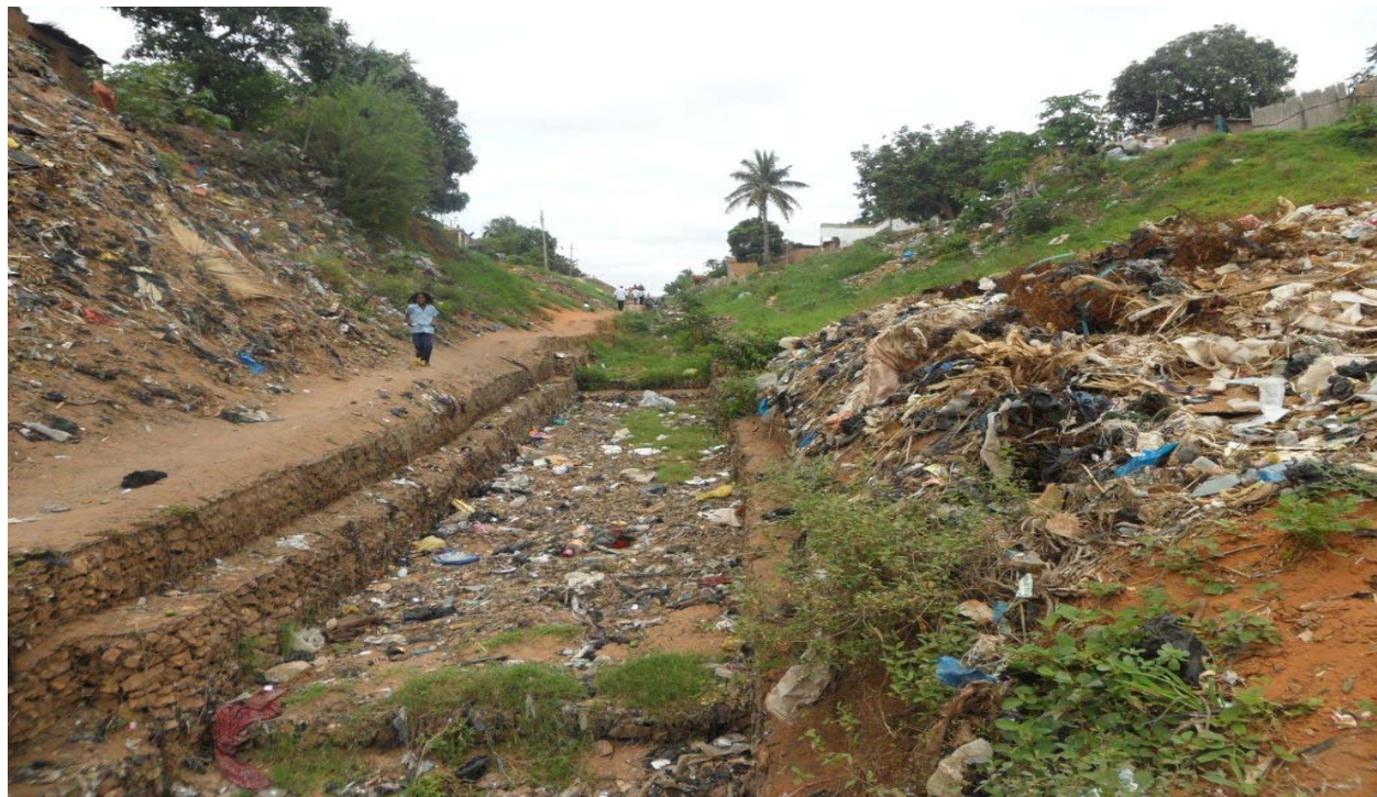
Figura 3: Continuidade do Sistema de drenagem