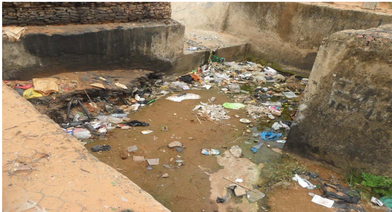
Figura 2: Sistema de drenagem de águas pluviais