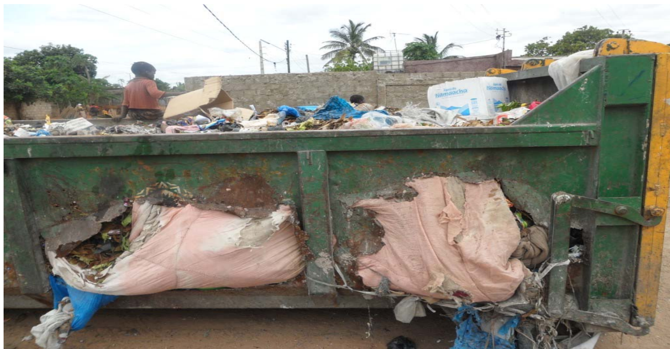
Figura 1: Contentor de lixo existente nas proximidades da cratera