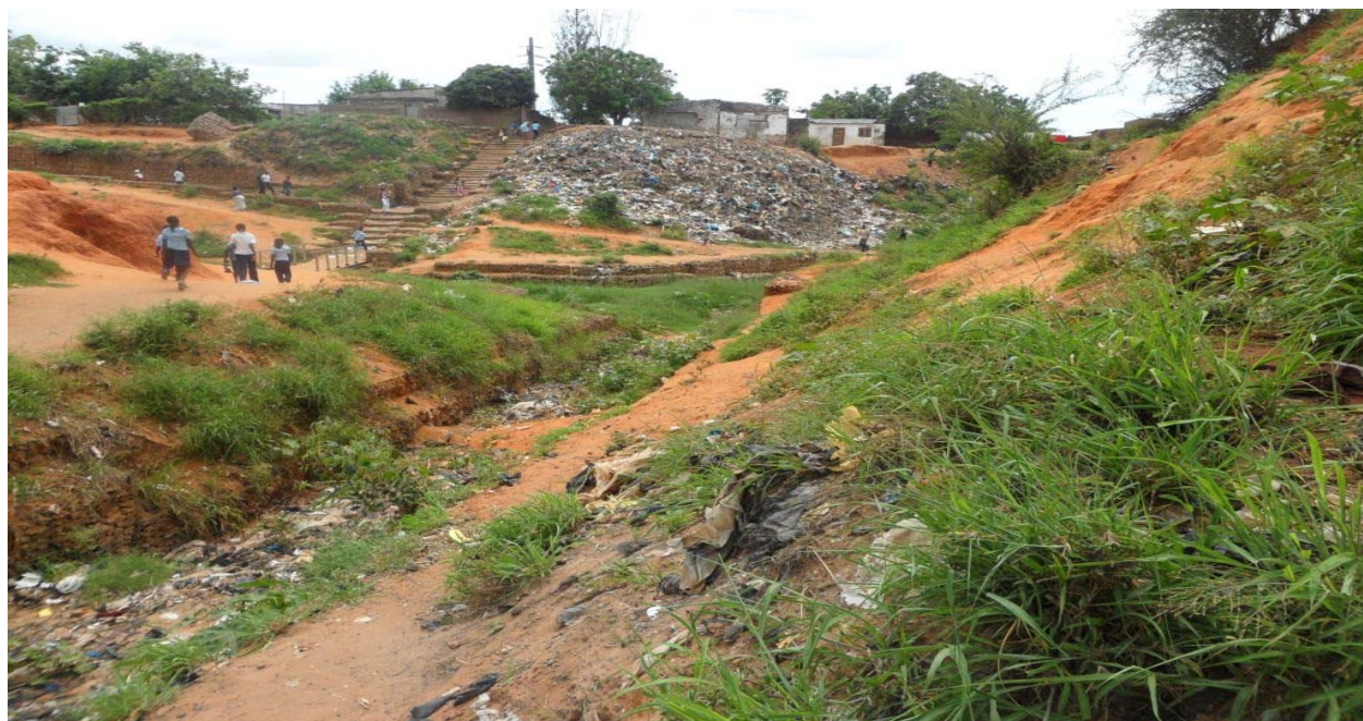
Figura 4: Cratera aberta pelas enxurradas de 2000, vulgarmente conhecida por “Cova”