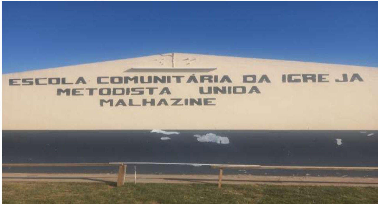
Figura I: Escola Comunitária da Igreja Metodista Unida de Malhazine