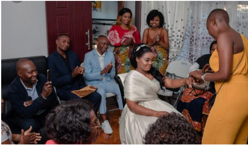
2. A noiva sendo colocada a aliança e as joias

seguir, uma pequena festividade, na qual os parentes da noiva exibem-se com as novas vestes e a dança e a mistura de cantos são inseparáveis, encaminhando o fim da cerimônia.